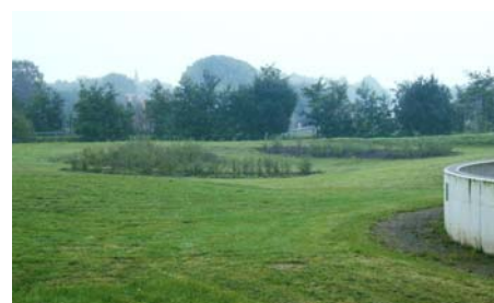
Bilderreihe: Versickerungsmulde mit Weidengruppen vorher / im Ausführungsplan / unmittelbar nach Anlage / nach 2. Pflegegang