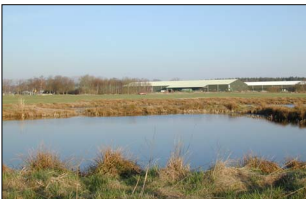
Lagerhallen der GROKA GmbH & CO. KG mit Feuchtbiotop

Das Planungsbüro Wirz hat - im Auftrag der Gemeinde Uetze - beurteilt, welchen Eingriff in Natur und Landschaft die mögliche Erweiterung der gewerblichen Bauflächen verursachen würde. Auf dieser Grundlage ist ein Konzept für landschaftspflegerische Ausgleichs- und Ersatzmaßnahmen erarbeitet worden, das bei einer Änderung des Bebauungsplans als Bestandteil der Begründung Verwendung finden kann. Bereits 1995 ff. realisierte und jetzt neu vorgeschlagene Maßnahmen ergänzen sich zu einem fachlich sinnvollen Gesamtkonzept.