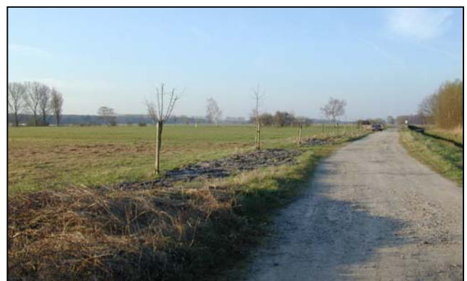
Lage der möglichen landschaftspflegerischen Maßnahmen